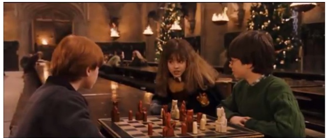
Harry Potter et ses amis jouent aux échecs

Votre enfant peut découvrir le jeu d'échecs à l'occasion de la lecture de Tintin . Le jeu d'échecs est aussi un élément important du premier volet de la saga Harry Potter . Dans de nombreux épisodes de Zorro, Don Diego de la Vega joue aux échecs avec Bernardo ou avec son père. Autant d'occasions de faire découvrir le jeu à votre enfant !