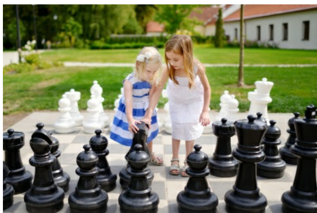
Deux filles qui jouent aux échecs sur un échiquier géant

Par exemple, la fédération française promeut l'initiation aux échecs à l'école maternelle . Un document intitulé L'initiation au jeu d'échecs à l'école maternelle résume les bienfaits du jeu d'échecs pour les enfants de cet âge et les initiatives de certains enseignants. Les échecs sont une activité en milieu scolaire dans de nombreux pays (voir par exemple cette présentation (en anglais)).