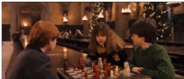
Harry Potter et ses amis jouent aux échecs

Votre enfant peut découvrir le jeu d'échecs à l'occasion de la lecture de Tintin . Le jeu d'échecs est aussi un élément important du premier volet de la saga Harry Potter . Dans de nombreux épisodes de Zorro, Don Diego de la Vega joue aux échecs avec Bernardo ou avec son père. Autant d'occasions de faire découvrir le jeu à votre enfant !