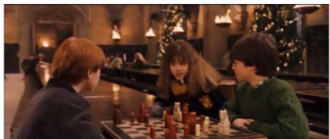
Harry Potter et ses amis jouent aux échecs

Votre enfant peut découvrir le jeu d'échecs à l'occasion de la lecture de Tintin . Le jeu d'échecs est aussi un élément important du premier volet de la saga Harry Potter . Dans de nombreux épisodes de Zorro, Don Diego de la Vega joue aux échecs avec Bernardo ou avec son père. Autant d'occasions de faire découvrir le jeu à votre enfant !